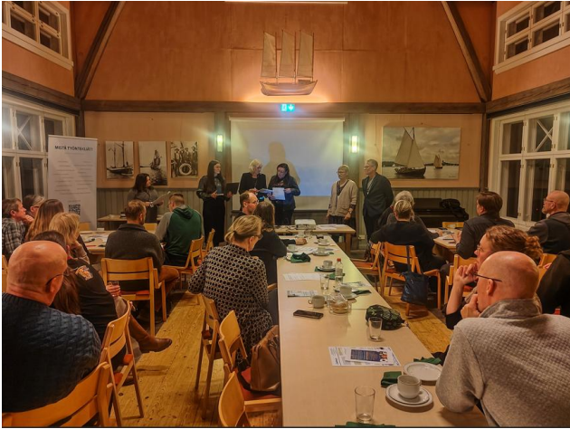
Kuva ja teksti: Janne Lehtinen

Keskiviikkona 29.1.2025 järjestettiin Santtion Mainingissa ilta Pyhärannan yrittäjille. Tapahtuman järjestivät Ukipolis Oy, Laitilan-Pyhärannan yrittäjät Ry sekä Pyhärannan kunta.