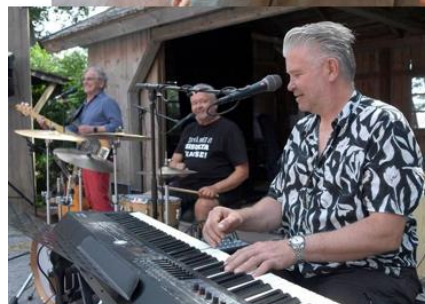
Pyhärantapäivä 2024