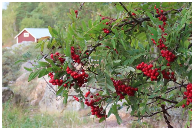
Kuva on kotiseutuyhdistyksen valokuvakisan satoa.

Sateen sattuessa ollaan sisätiloissa. Puffetti. Vapaa pääsy.